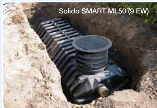
Solido SMART ML50 (9 EW)