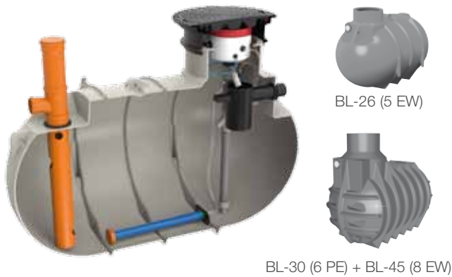
BL-30 (6 PE) + BL-45 (8 EW)