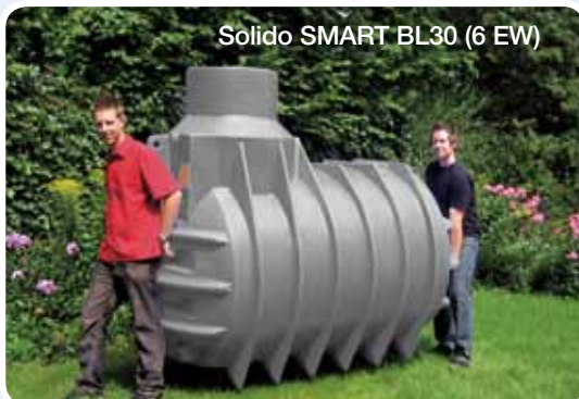
Solido SMART BL30 (6 EW)