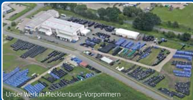
Unser Werk in Mecklenburg-Vorpommern